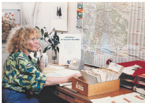
Seit vielen Jahren unterstützt das Zürcher Rote Kreuz psychisch Belastete (Bild ganz links). Zur Finanzierung von Hilfsangeboten verkauften Freiwillige Mimosen (Bild oben). Eine Mitarbeiterin koordiniert Rotkreuz-Fahrten (Bild links).

Unter anderem gibt es Besuchsnachmittage in Alterszentren, beispielsweise im Alterszentrum Adlergarten. Engagierte Freiwillige des Jugendrotkreuzes besuchen die Bewohnenden und verbringen abwechslungsreiche Stunden mit ihnen. Manchmal erklären die Jugendlichen ihnen die neusten Trends der digitalen Welt, mal erzählen die Bewohnenden aus ihrem Leben. Das Rote Kreuz Zürich ist dem Alterszentrum Adlergarten schon länger ein treuer Begleiter: Bereits 1987 wurden mit dem Transportcar für beeinträchtigte Personen Bewohnende aus dem Zentrum abgeholt und für erholsame Stunden und mehr Lebensqualität zu interessanten Ausflugszielen gebracht.